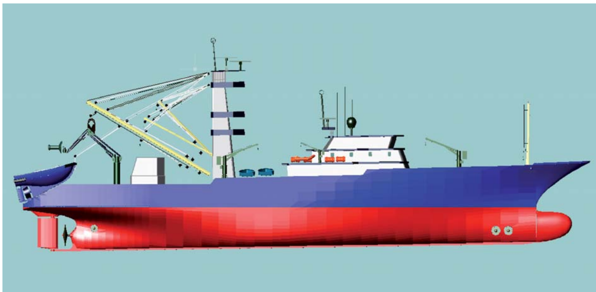
Infografía de BAIP 2020, un proyecto de I+D+i en el que participa SENER.

En los últimos años, se ha extendido la utilización de he-